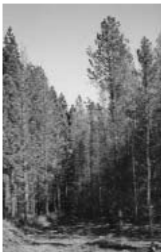
● Rodal con ataque severo de S. noctilio

Como consecuencia de la detección de la avispa S. noctilio en las provincias de Misiones y Corrientes, se definieron estrategias tendientes al control de la plaga. Uno de los logros más importantes fue la instalación, en la Estación Experimental Agropecuaria Montecarlo del INTA, de un laboratorio de cría del nematodo B. siricidicola , que es el controlador biológico más efectivo para este insecto. Este laboratorio se puso en funcionamiento a principios de 1996 mediante las acciones conjuntas de los orga-